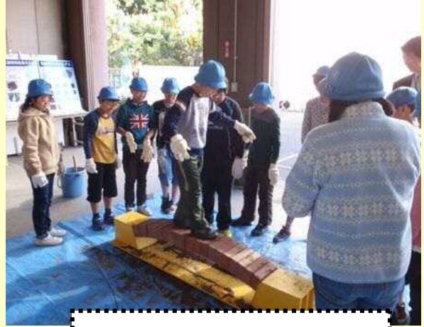
レンガで橋を作ろう